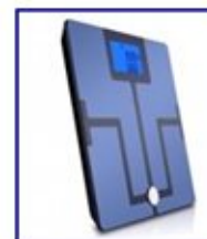
Báscula con Bluetooth Fitme Pro para baño.