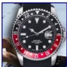
Reloj Mariner Commander Caballero de la colección AW.

AUDÍFONOS JOYERÍA COSMÉTICA MOTOR HOGAR SALUD