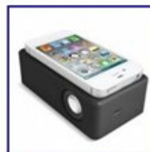
Altavoz portátil por inducción inalámbrica para móviles.