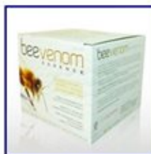
BEE VENOM de L.A. California. Acción antioxidante y anti-edad, revitaliza y purifica al cutis y cabello.