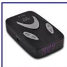
Avisador de radar Anxel Driver F10 posee un potente GPS preciso, moderno y fácil de utilizar.