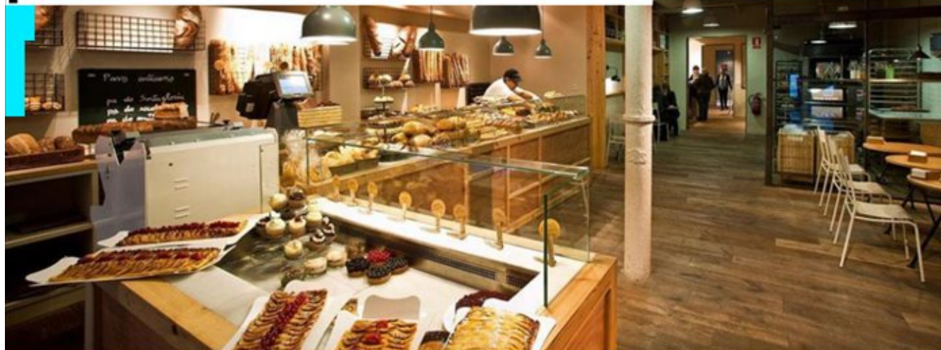
Interior de una de las panaderías de Santagloria

La cadena Foodbox cierra cuatro locales de la histórica cadena El Molí Vell mientras continúa con la expansión de la marca Santagloria por la vía de las franquicias